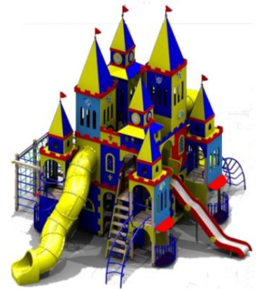
Детский игровой комплекс «Королевский дворец»